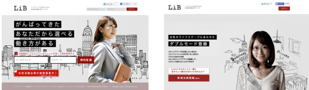
画像：ハイキャリア女性専用転職サイト「LiB(リブ)」トップページ

過去の最高到達年収が400万円以上のハイキャリア女性が、年齢やライフイベントに合わせた正規雇用の働き方を選べる転職支援サービス。女性ならではの多様な状況をコンサルティングできる優れたキャリアコンサルタントとヘッドハンターとの出逢いを提供するプラットフォームです。